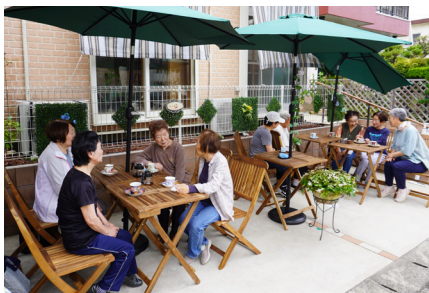
オープンカフェで楽しくおしゃべり

みんなで相談。地域の人が安心して集まれるように、駐車場を利用したオープンカフェを考えます。気心知れた仲間同士アイデアを出し合い、コラボ四街道に応募することを決めました。 オープンカフェの目玉は、自治会活動で知り合った千代田在住のバリスタが淹れる本格コーヒー。 「ワンコインでコーヒーとケーキを楽しみながら、地域みんなでおしゃべりができるカフェを、月1回開く予定です。どうしたらちょっと贅沢な時間を楽しんでいただけるか考えています」スタッフは近所の皆さんの理解に感謝しながら、オープンの準備を進めています。