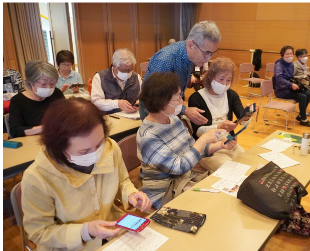
大盛況だった説明会