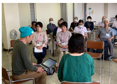
27名が参加した市民活動団体交流会

令和5年度、みんなで地域づくりセンターでは「新しい人、団体との出会いを増やすこと」、また「既存の団体の連携・協働」をキーワードに、より充実した活動ができるようお手伝いするため、年間を通してセミナーを開催しています。