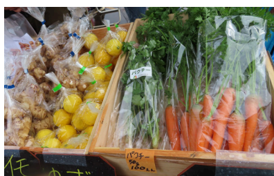
2022年のフェスタの様子

日時 9月18日 (月・祝) 10:00～14:00 会場 四街道市文化センター (広場および屋内ホワイエ・展示ホール) ※少雨決行 内容 地元産の新鮮な農産物と手作りの加工品やお菓子、雑貨・木工・手工芸品などを販売 主催 ちばユニバーサル農業フェスタ2023in四街道実行委員会 問合せ 実行委員会事務局 NPO法人地域創造ネットワークちば TEL 043-270-5601 (土・日・祝休) E-mail souzounet@coast.ocn.ne.jp