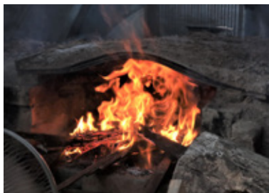
窯口で勢いよく上がる炎。 原木は煙でいぶされていく

五感で季節のうつろいを楽しみ、そして森の資源を有効に使う。森はメンバーが至福の時間を過ごすための大切な場所です。