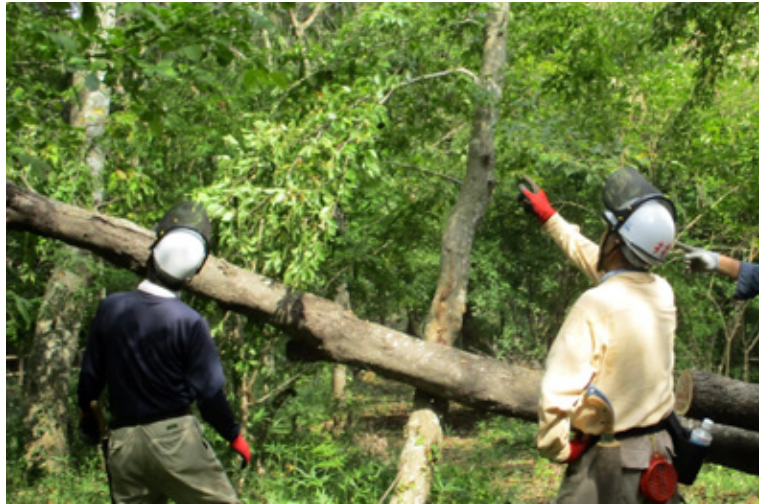
危険木の処理は、入念に確認しながら