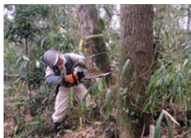
安全を確保し慎重に進む チェーンソーの作業

や刈り払い機などを使う危険で体力のいる作業を伴い、メンバーは気が抜けません。森の守り人として、強く温かな志を持った若い世代の参加が熱望されています。