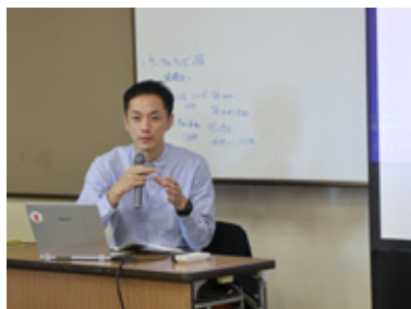
社会福祉法人 福祉楽団 https://www.gakudan.org/

昨年5月の第1回に引き続き、11月10日「みんなで災害支援を考えよう～福祉避難所って？～」を開催しました。今回も多くの方の市民の関心を集め、障害のある人や市内の福祉避難所、障害者・高齢者施設従事者・地域の人など52人が参加しました。