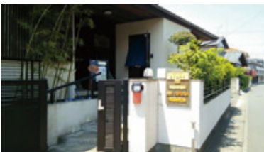
さくらそうは市役所そば。人が集うのにぴったりの場所

オレンジカフェでは、理学療法士や作業療法士の指導による体操とおしゃべり会が行われ、当事者にも介護者にも一人一人に寄り添