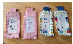
スタッフお手製の小さい子のための手作りの名札

来てくれるみんながゆったりと絵本を楽しめるように、文庫の運営や受け付け、イベントの企画、準備など、やることはいろいろ！できるところからゆっくり参加してください。問い合わせは文庫まで