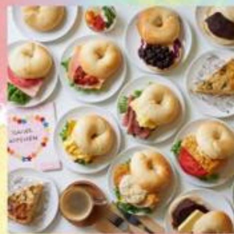
●ベーぐるきッチン●