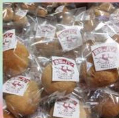
●よつグルメ研究会●