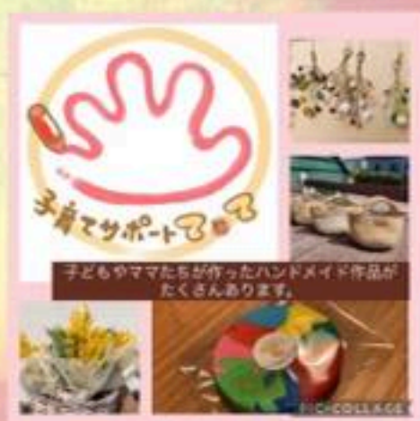
★子育てサポートてとて★