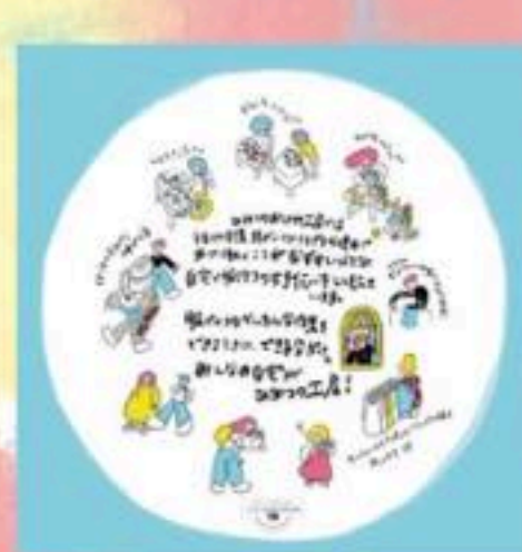
●ひみつのおしゃれ工房●