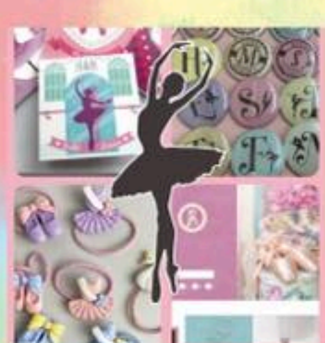
●市民のためのバレエ●