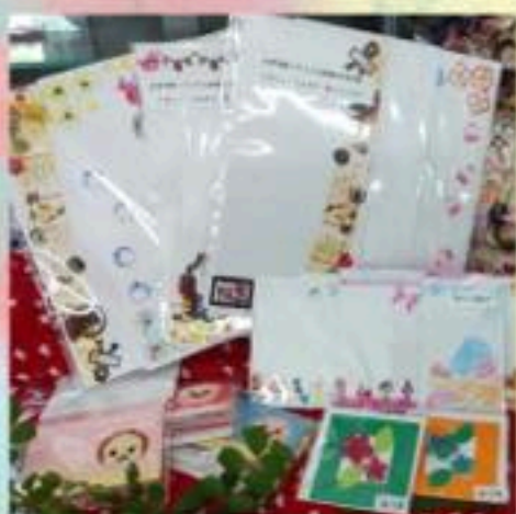
★ワークショップ四街道★